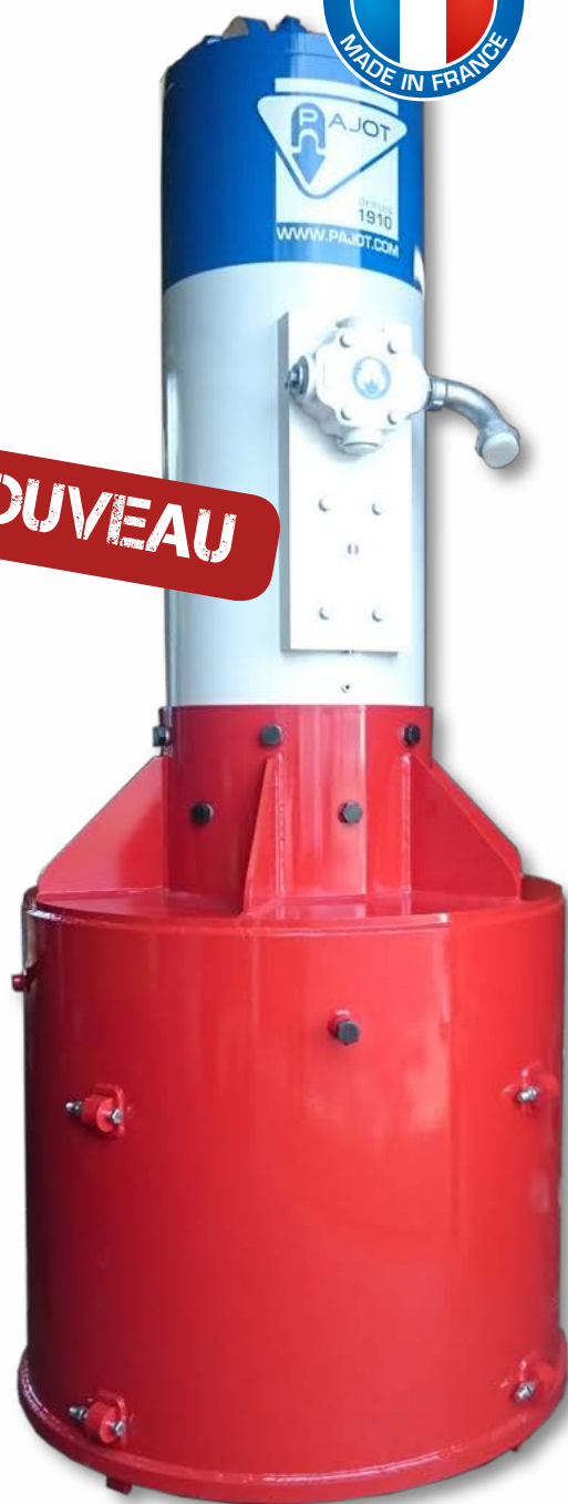
Guide fourreau pour tubes, H, pieux bois