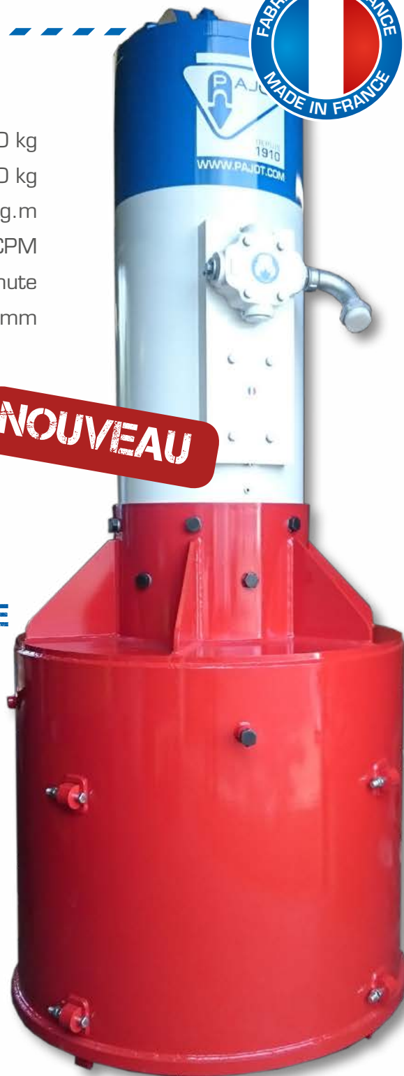
Guide fourreau pour tubes, H, pieux bois