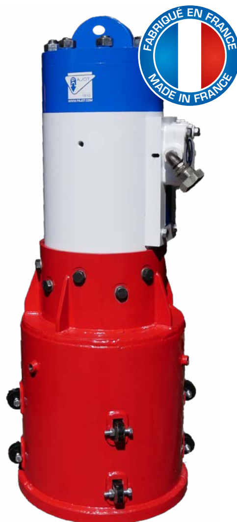
Guide fourreau pour tubes, H, pieux bois